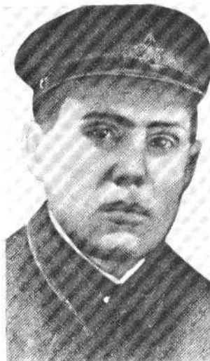
Буюклы Антон — Герой Советского Союза