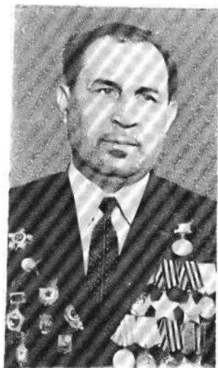
Маргарит Василий Иванович Бүүк Ватан жөнги ветераны бууикү гүндä