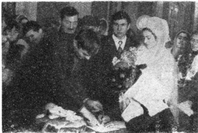
Торжественная регистрация брака, село Этудия Вулканештского района