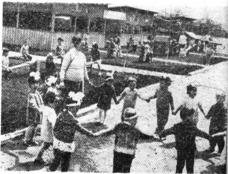
В детском саду, село Гайдары Чадыр-Лунгского района