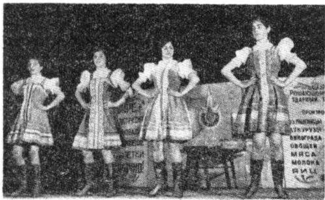
Победитель Республиканского слета агиткультбригад 1974 года, село Червоноармейское Болградского района Одесской области