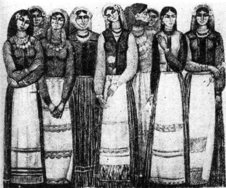
Гагаузские девушки (линогравюра, художник Д. Савастин).